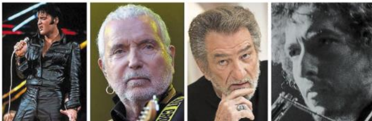
Parmi les coffrets proposés, Elvis Presley en cuir noir, l'essentiel de Lavilliers, Eddy Mitchell et des sessions new-yorkaises de Bob Dylan.

Une demi-intégrale Eddy Mitchell, l'essentiel de Lavilliers, l'ensemble des albums de Kate Bush remastérisés. Il y a du bon dans les nouveaux coffrets sortis pour cette fin d'année.